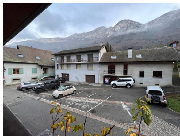
place des enfants (centre bourg historique)