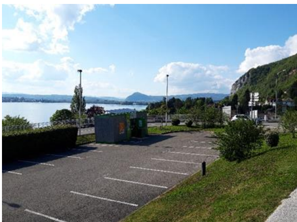
parking des Pérouses