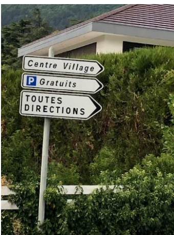
Près de la plage, signalisation incitant les touristes à stationner gratuitement en centre village