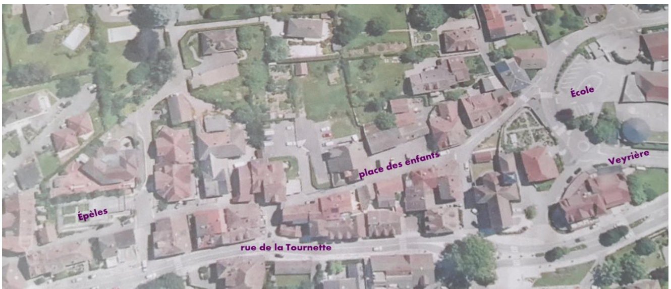
centre village Veyrier-du-Lac

Veyrier est un village très ancien, avec son histoire propre, son patrimoine naturel, culturel et bâti, dont beaucoup d'habitants souhaitent qu'il ne participe pas davantage à la « disneylandisation » en marche et à l'urbanisation galopante du bassin annécien.